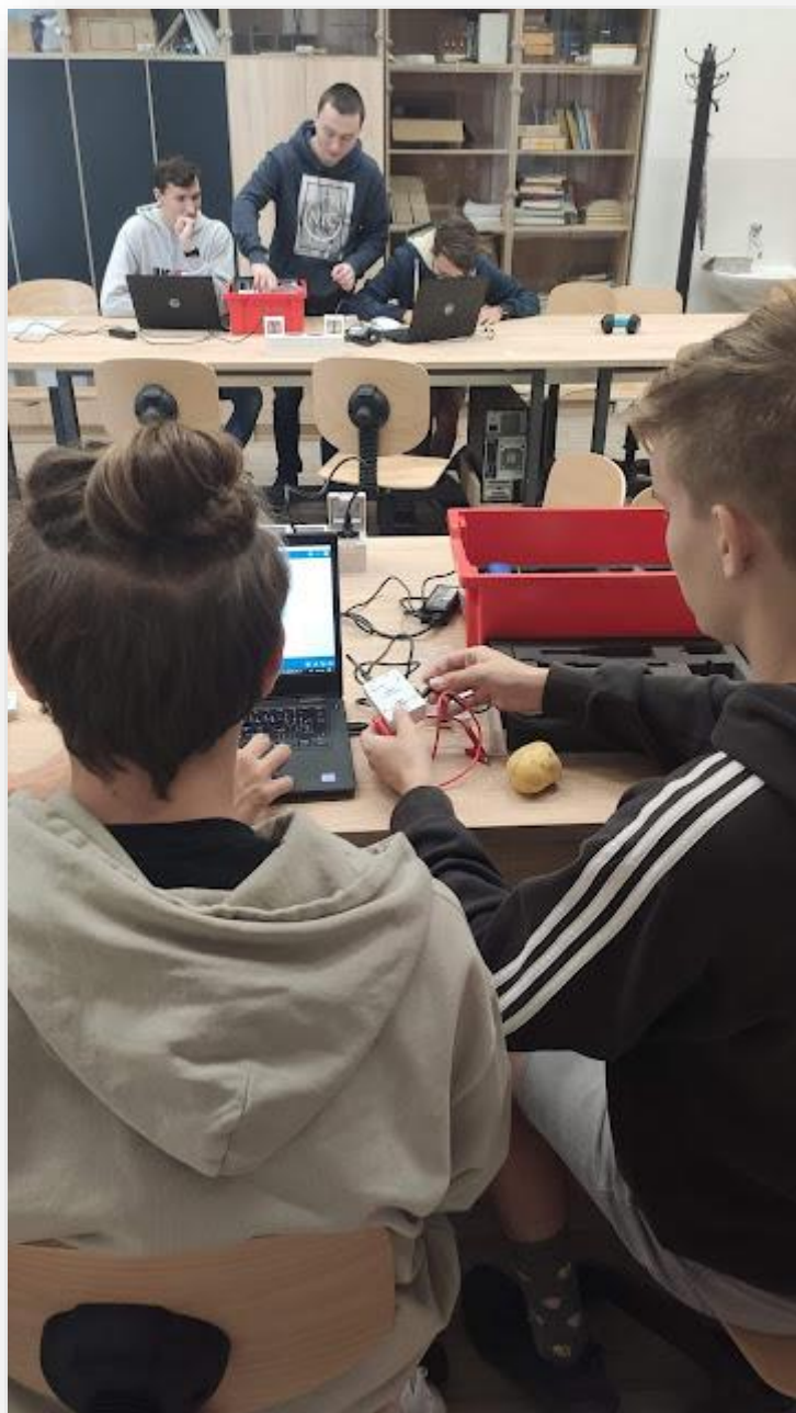
Obrázek č. 3 – Práce na úloze baterie z brambor