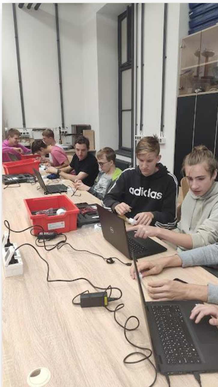
Obrázek č. 1 – Seznámení se systémem Pasco