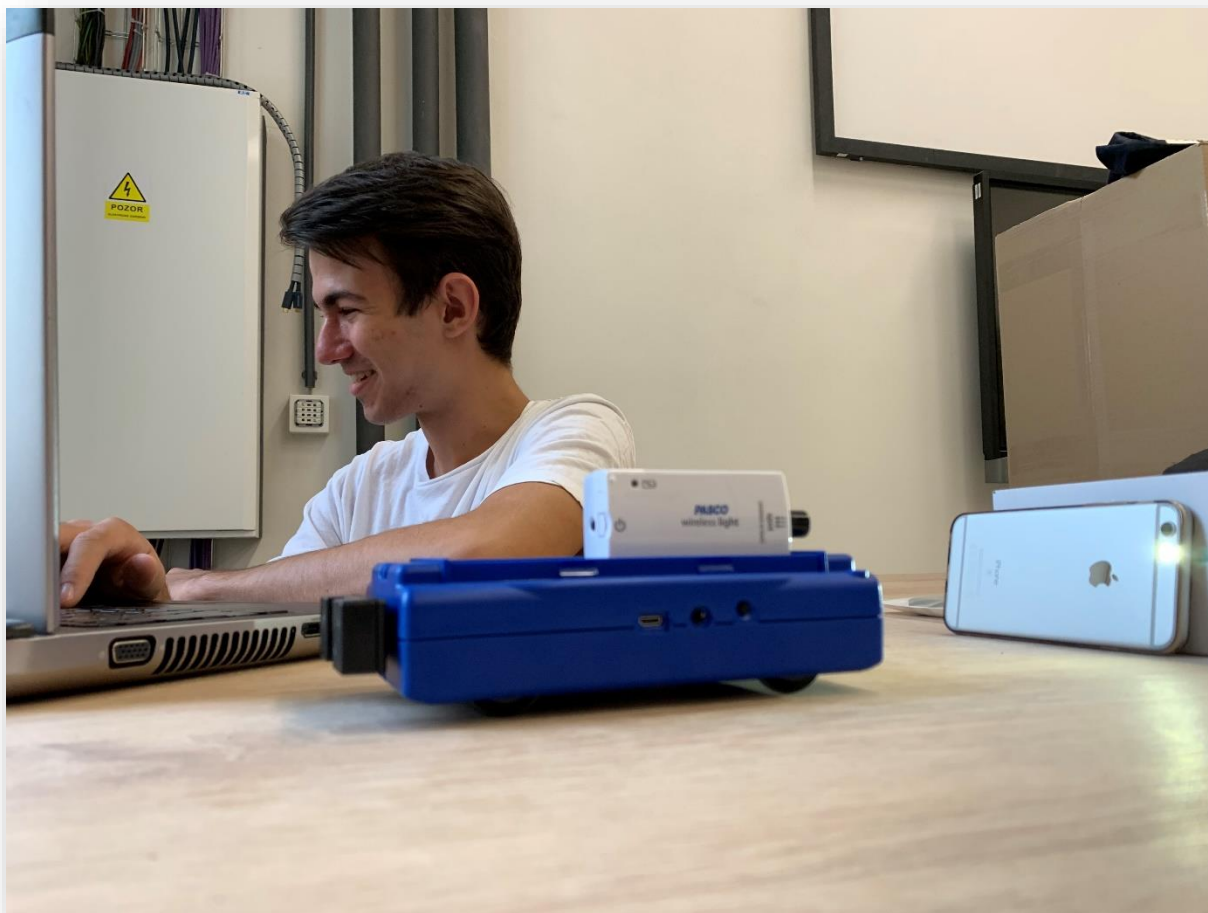
Obrázek č. 5 – Práce na úloze měření deformační zóny