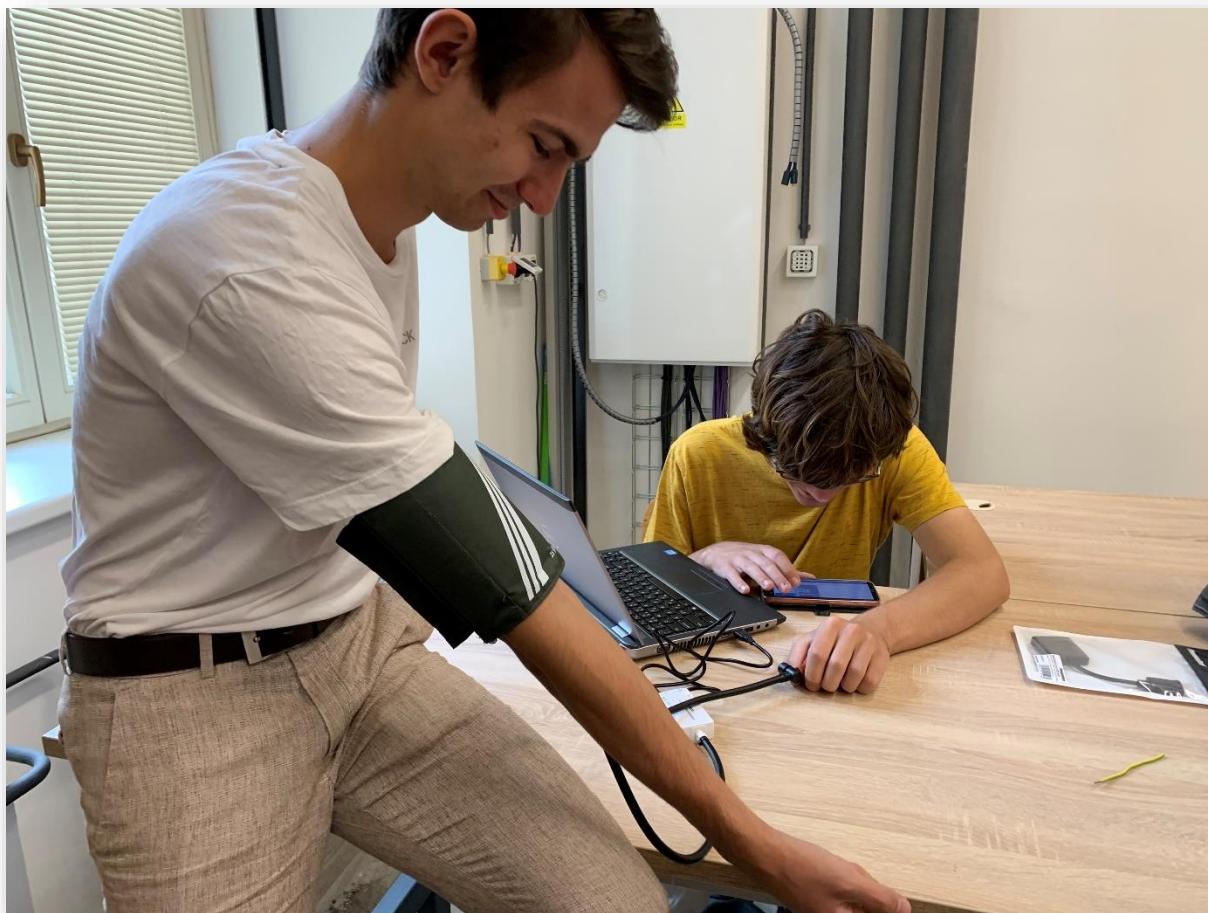
Obrázek č. 7 – Práce na úloze měření krevního tlaku