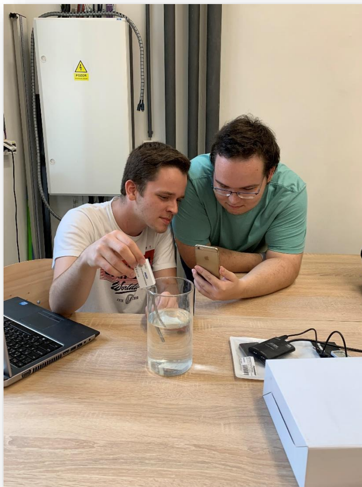
Obrázek č. 6 – Práce na úloze měření teploty tání